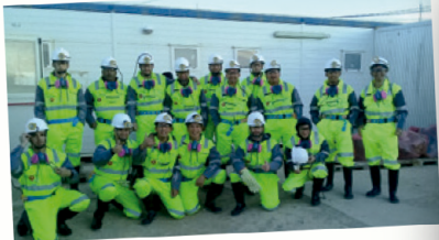
Curso Colaborador Minero 2019