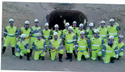
Curso Colaborador Minero 2019