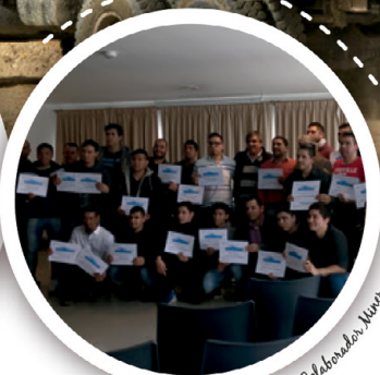
Entrega de diplomas Curso Colaborador Nuevo

Minera Santa Cruz tiene como objetivo desarrollar su actividad generando impactos positivos en la región en la que opera. Desde la oficina de Relaciones Comunitarias trabajamos día a día con las autoridades municipales, provinciales y demás actores sociales con el objeto de identificar las necesidades de la comunidad y así asegurar que los aportes que realizamos redunden en un beneficio efectivo para todos sus integrantes. En ese sentido, llevamos adelante diversos programas de aportes basados principalmente en los siguientes pilares: Educación, Salud e Infraestructura.