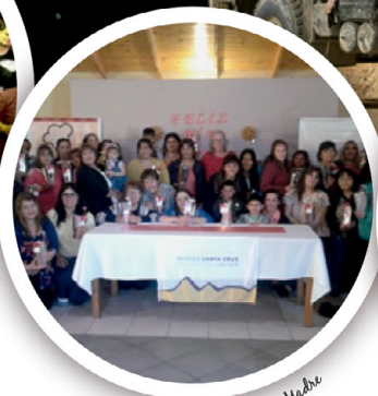
Evento Día de la Madre